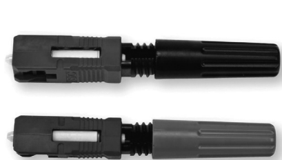
Коннекторы NPC 8802-T (верхнее фото – коннектор с прямой состыковкой оптических волокон, нижнее фото – коннектор с угловой состыковкой оптических волокон)