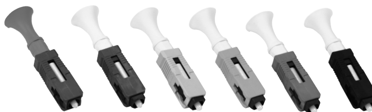
Коннекторы типа 8800 NPC SC