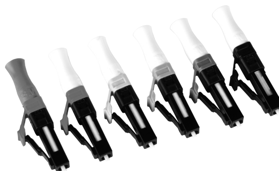
Коннекторы типа 8830 NPC LC